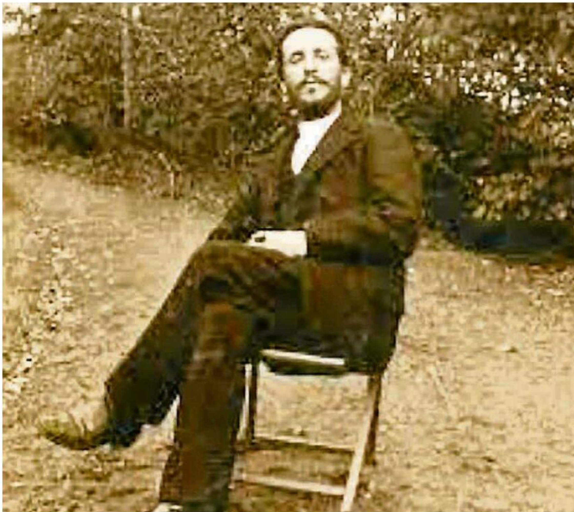
Edouard-Alfred Martel a érigé la spéléologie au rang de science.