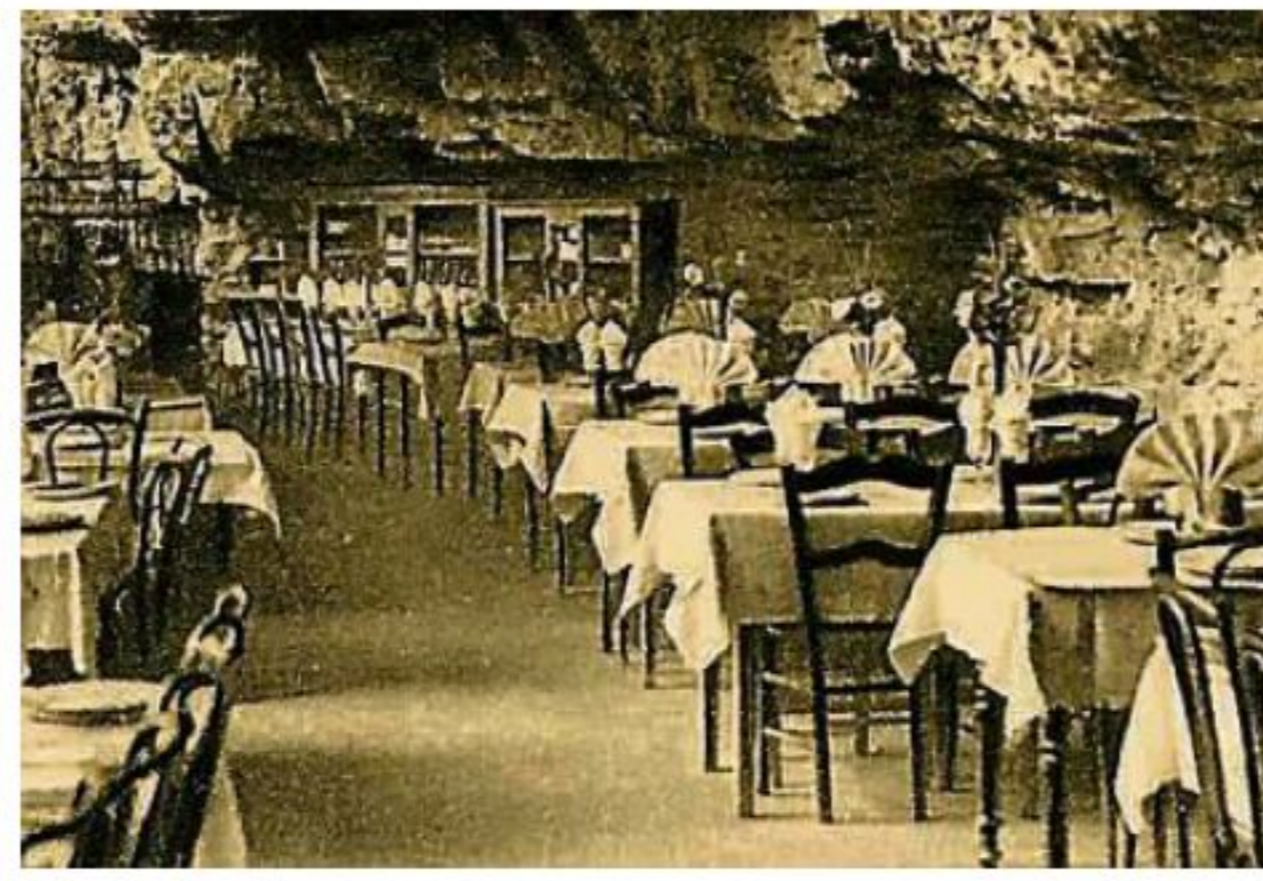
Un restaurant avait été aménagé à Padirac.